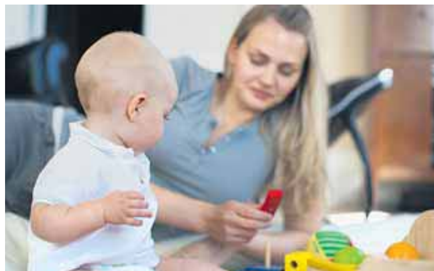
Alleinerziehende leisten viel – die SPD-Bundestagsfraktion will sie mit vielerlei Maßnahmen unterstützen.