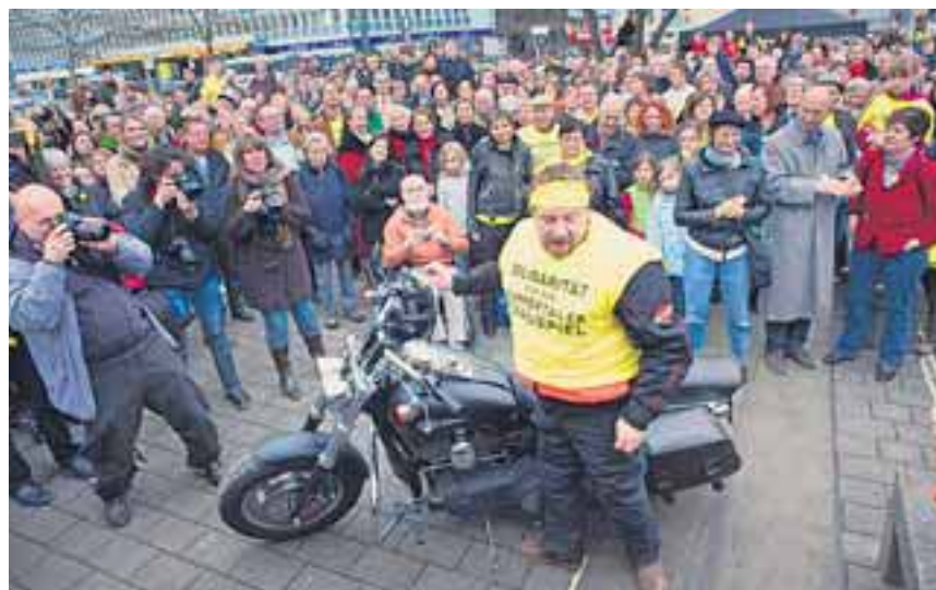
„Wuppertal wehrt sich“: Die Bürgerinnen und Bürger der Bergischen Metropole sind nicht bereit, die Zeche für die Krise allein zu zahlen.