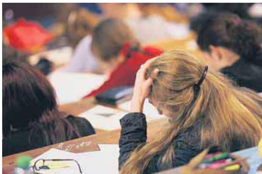
Nur zehn Prozent aller Studierenden werden von den neuen Stipendien profitieren.

Union und FDP haben sich offenbar darauf verständigt, dem drohenden