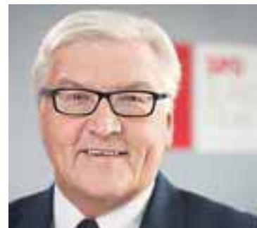
Von Frank-Walter Steinmeier, Vorsitzender der SPD-Bundestagsfraktion